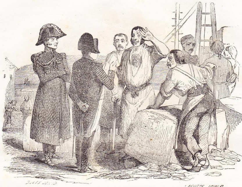
Il sortait pour inspecter les travaux et s'arrêtait pour interroger les ouvriers.